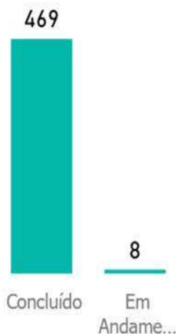
TOTAL POR STATUS

De modo detalhado, a distribuição e o quantitativo frente às formas de registro das manifestações podem ser observados na tabela abaixo: