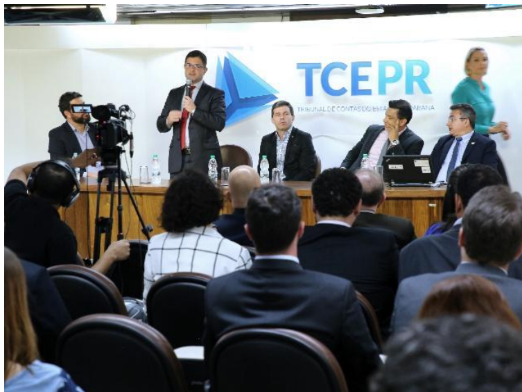
Imagem do evento de encerramento realizado no dia 03/12/2019; disponível em: http://www1.tce.pr.gov.br/fotos/album-orientados-pelo-tce-pr-universitarios-avaliam-portais-da-transparencia-municipais/7505/N ; acesso em 04/02/2020 às 12:16.