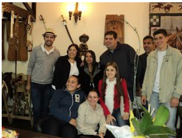
EM 06/07/12 PAFIANOS EM LOJA DE ARTESANATO AO LADO DO RESTAURANTE MADALOSSO - CLIQUE NA FOTO PARA AMPLIAR