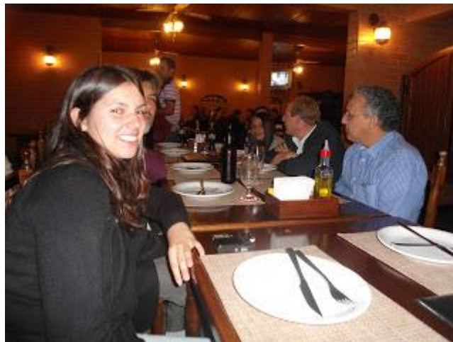
PAFIANOS NA PIZZARIA EM CURITIBA APÓS O PRIMEIRO DIA DE EVENTO - CLIQUE NA FOTO PARA AMPLIAR