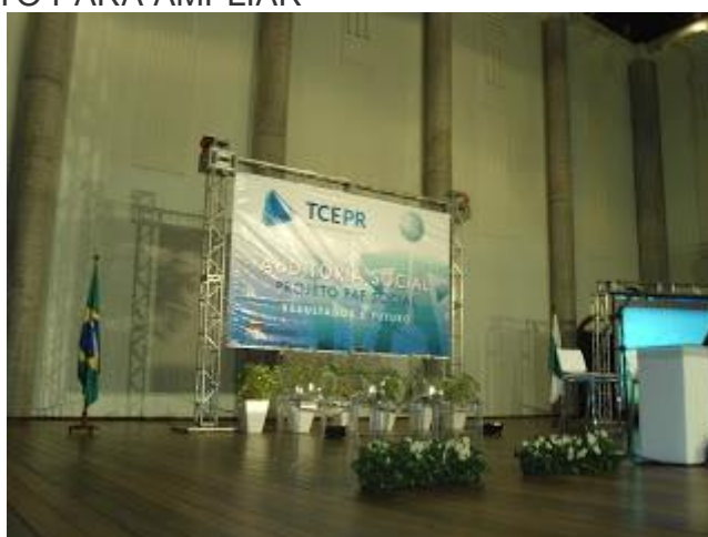
PAINEL OFICIAL DO EVENTO - CLIQUE NA FOTO PARA AMPLIAR