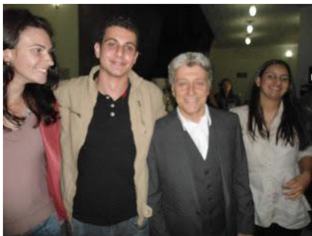
PAFIANOS DE CAMPO MOURÃO AO LADO DO JORNALISTA CACO BARCELOS MINUTOS ANTES DA SUA PALESTRA NO CANAL DA MÚSICA EM CURITIBA - 05/07/12 - CLIQUE NA FOTO PARA AMPLIAR