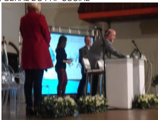
DE VERMELHO PROFESSORA DE ENFERMAGEM DA FAFIPA NO MOMENTO DA SUA APRESENTAÇÃO - CLIQUE NA FOTO PARA AMPLIAR