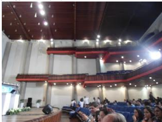
VISÃO DE CIMA DO CANA DA MÚSICA - CLIQUE NA FOTO PARA AMPLIAR