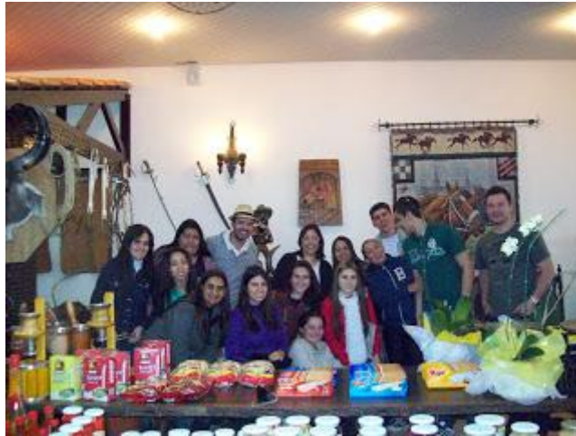
PAFIANOS EM RESTAURANTE EM IRATI A CAMINHO DO EVENTO EM CURITIBA (05/07/12) - CLIQUE NA FOTO PARA AMPLIAR

Este espaço é destinado a compartilhar com a comunidade minhas ações acadêmicas e profissionais. Também será utilizado para divulgar especialmente as ações de colegas economistas e outros profissionais e/ou pessoas da comunidade quando for necessário. O espaço servirá para debate sobre economia e política, onde serão manifestadas minhas opiniões a respeito, enquanto cidadão e professor universitário.