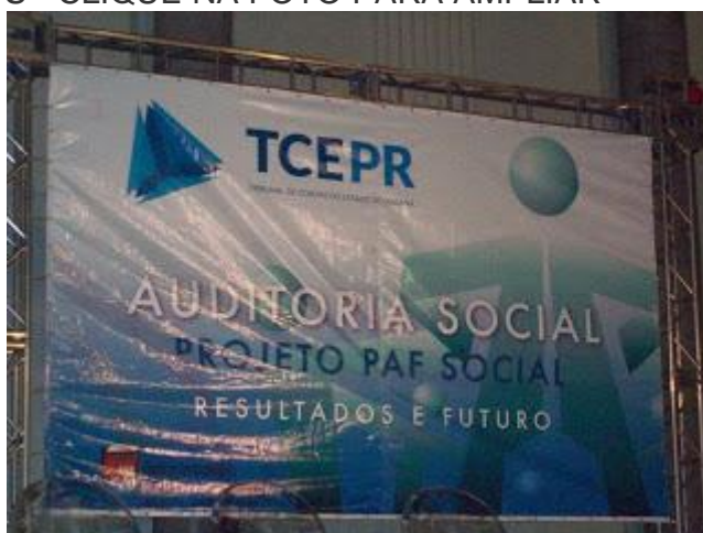
PAINEL OFICIAL DO EVENTO - CLIQUE NA FOTO PARA AMPLIAR