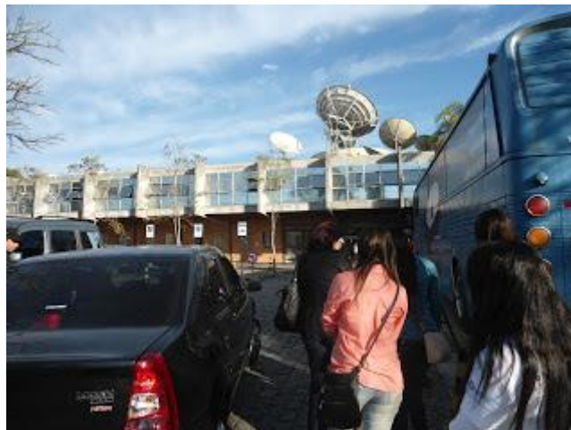
PAFIANOS CHEGANDO NO CANAL DA MÚSICA EM CURITIBA NO DIA 06/07/12 - CLIQUE NA FOTO PARA AMPLIAR