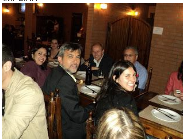
PAFIANOS NA PIZZARIA EM CURITIBA APÓS O PRIMEIRO DIA DE EVENTO - CLIQUE NA FOTO PARA AMPLIAR