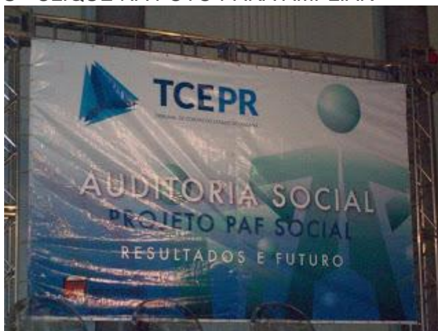
PAINEL OFICIAL DO EVENTO - CLIQUE NA FOTO PARA AMPLIAR