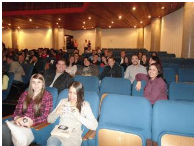
PAFIANOS NO INTERIOR DO CANAL DA MÚSICA EM CURITIBA (05/07/12) AGUARDANDO A ABERTURA DO EVENTO E POSTERIOR PALESTRA COM CACO BARCELOS - CLIQUE NA FOTO PARA AMPLIAR