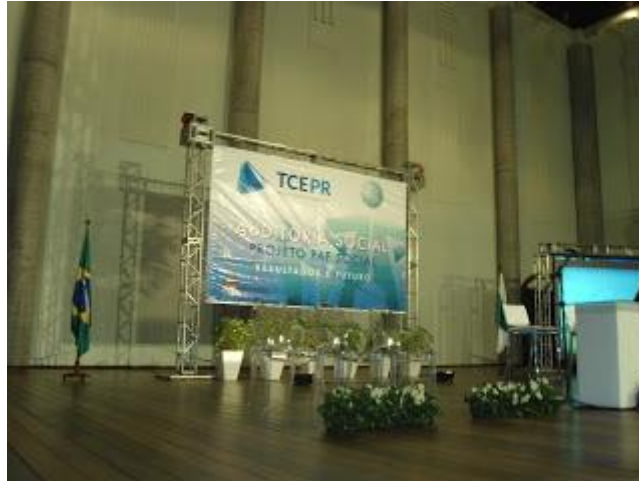
PAINEL OFICIAL DO EVENTO - CLIQUE NA FOTO PARA AMPLIAR