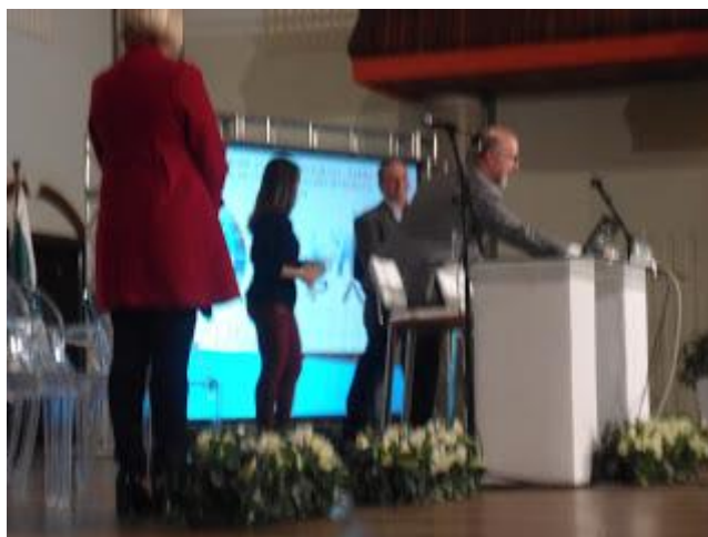
DE VERMELHO PROFESSORA DE ENFERMAGEM DA FAFIPA NO MOMENTO DA SUA APRESENTAÇÃO - CLIQUE NA FOTO PARA AMPLIAR