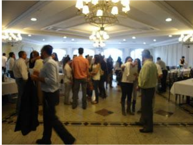
EM 06/07/12 INTERIOR DO RESTAURANTE MADALOSSO - CLIQUE NA FOTO PARA AMPLIAR