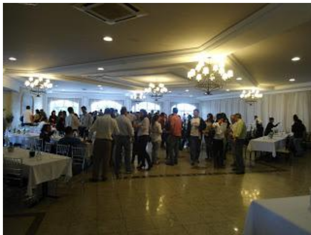
EM 06/07/12 INTERIOR DO RESTAURANTE MADALOSSO - CLIQUE NA FOTO PARA AMPLIAR