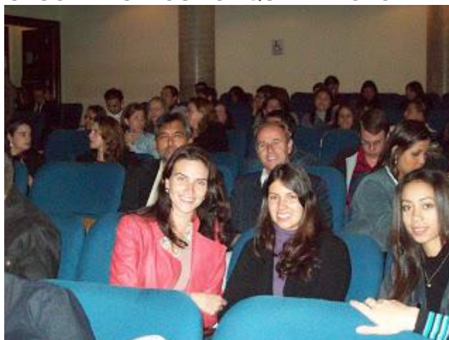
PAFIANOS NO INTERIOR DO CANAL DA MÚSICA EM CURITIBA (05/07/12) AGUARDANDO A ABERTURA DO EVENTO E POSTERIOR PALESTRA COM CACO BARCELOS - CLIQUE NA FOTO PARA AMPLIAR