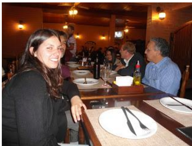
PAFIANOS NA PIZZARIA EM CURITIBA APÓS O PRIMEIRO DIA DE EVENTO - CLIQUE NA FOTO PARA AMPLIAR