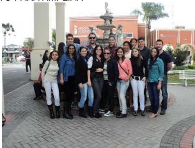
PAFIANOS NO PÁTIO DO RESTAURANTE MADALOSSO EM CURITIBA EM 06/07/12 - CLIQUE NA FOTO PARA AMPLIAR