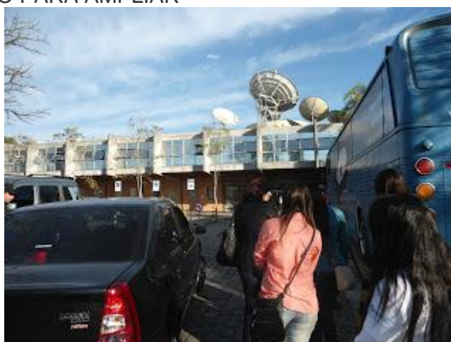
PAFIANOS CHEGANDO NO CANAL DA MÚSICA EM CURITIBA NO DIA 06/07/12 - CLIQUE NA FOTO PARA AMPLIAR