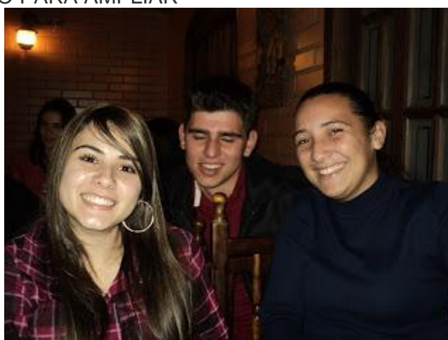
PAFIANOS NA PIZZARIA EM CURITIBA APÓS O PRIMEIRO DIA DE EVENTO - CLIQUE NA FOTO PARA AMPLIAR