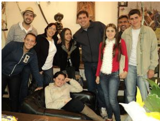
EM 06/07/12 PAFIANOS EM LOJA DE ARTESANATO AO LADO DO RESTAURANTE MADALOSSO - CLIQUE NA FOTO PARA AMPLIAR